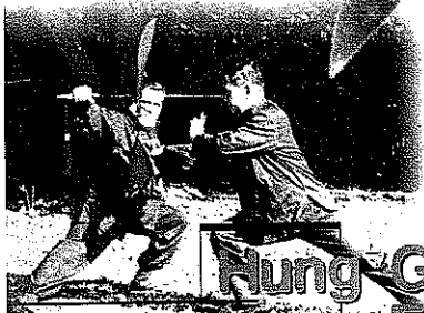
Hung Gar Kung Fu: la sua storia