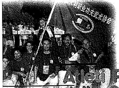
Ai lei PWKA: dalla Cina con allori